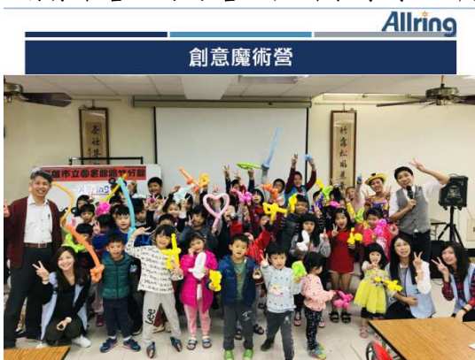
萬潤慈善公益信託基金活動一覽表：

萬潤公司不僅關懷當地，也致力於當地教育活動，例如閱讀紮根計畫、暑期育樂營、冬令營及戶外教學等，都盡心盡力不遺餘力。